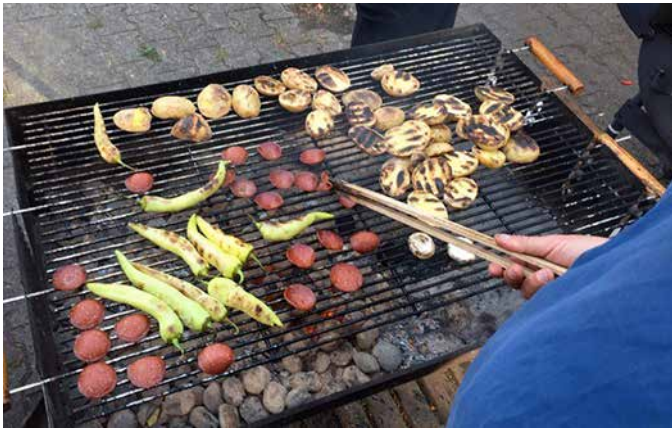
Grill komplett: Gemüse, Käse, Wurst und etwas Bauch.

Am Abend des Freitags, den 13. September 2019 fand im Jugendcafé "Laiv" das Jugendfest "Grill and Chill" statt, zu dem mehrere Träger der Jugendhilfe im Voraus eingeladen hatten. So handelte es sich um eine Kooperationsveranstaltung der AG-Jugend, verschiedener Träger der Jugendhilfe aus dem AVA-Kiez, die allesamt tatkräftig zum Gelingen des Festes beitrugen.