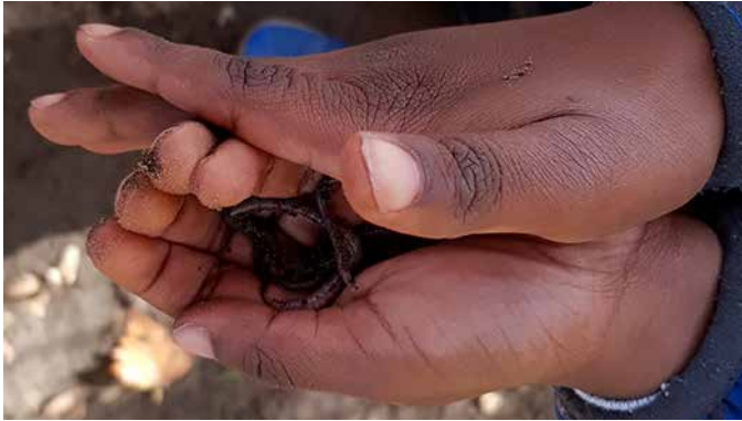
...und fleißige Tiere, ...

Als Zeichen der Dankbarkeit wurde allen Erwachsenen ein Notizbuch und allen Kindern ein Ausmalbuch mit Buntstiften überreicht. In entspannter Atmosphäre blieb auch Zeit sich in den Pausen bei Getränken und belegten Brötchen auszutauschen.