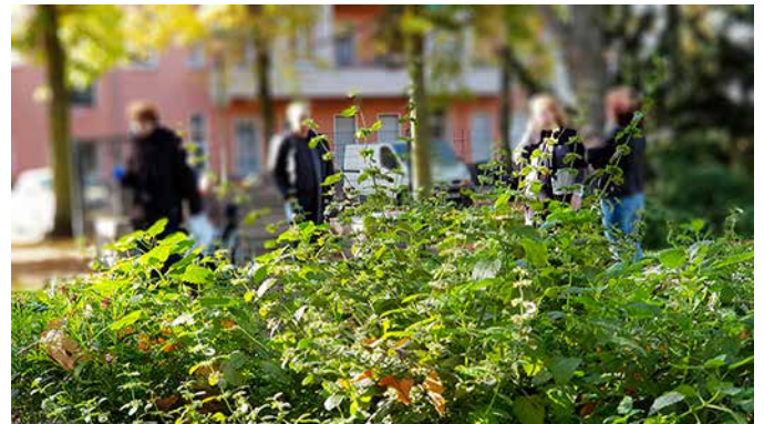
Um die Pflanzen vor dem Nachbarschafts- und Lesegarten kümmern sich viele Menschen...

Am Freitag, den 18. Oktober kamen vormittags zahlreiche Aktive im Lese- und Nachbarschaftsgarten zu einem Arbeitseinsatz zusammen. Mit dabei war die Cooperative Mensch eG aus der Kienhorststraße sowie Erzieherinnen und Kinder der Kita St. Rita, die sich seit über einem Jahr um den Garten und die Hochbeete kümmern.