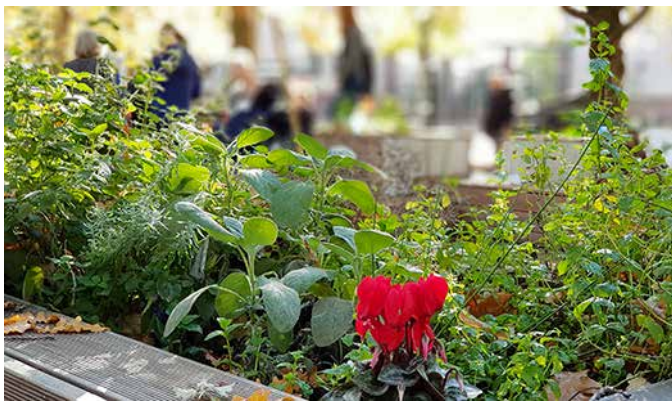
...damit dort alles wächst und blüht.

Als Zeichen der Dankbarkeit wurde allen Erwachsenen ein Notizbuch und allen Kindern ein Ausmalbuch mit Buntstiften überreicht. In entspannter Atmosphäre blieb auch Zeit sich in den Pausen bei Getränken und belegten Brötchen auszutauschen.