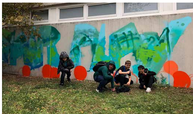
Voll legal: Graffiti-Künstler vor der Turnhalle der Reineke-Fuchs-Grundschule

Nachdem das Graffiti-Projekt an der Segenskirche erfolgreich abgeschlossen wurde, erhielten wir von der Schulleitung der Reinecke-Fuchs-Grundschule die Genehmigung, die Turnhalle zu verzieren. Unser Graffiti-Künstler einigte sich mit den Kids auf den Slogan „FairPlay“, umgeben von Basketbällen.