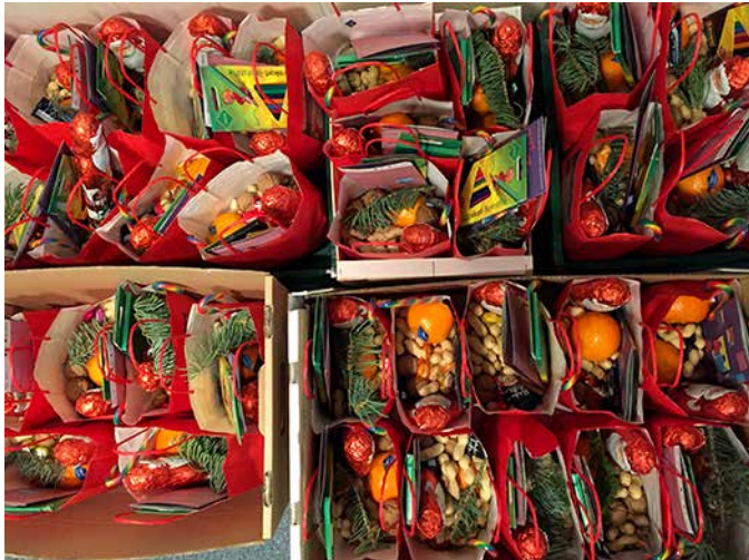
So sieht es aus, wenn der Nikolaus da war.

Auch im Auguste-Kiez wird der liebe Nikolaus dieses Jahr wieder seine Runde drehen und fein geputzte Stiefelchen mit allerlei süßen Köstlichkeiten füllen!