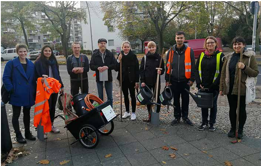
Die Teilnehmer/-innen der Pflanzaktion an der Scharnweberstraße...

Die Gewerbetreibenden des Gewerbenetzwerks „WIR FÜREUCH – Auguste-Kiez an der Scharnweberstraße“ haben am Freitag, den 25.10. tatkräftig angepackt und den Mittelstreifen der Scharnweberstraße mit Blumenzwiebeln bepflanzt.