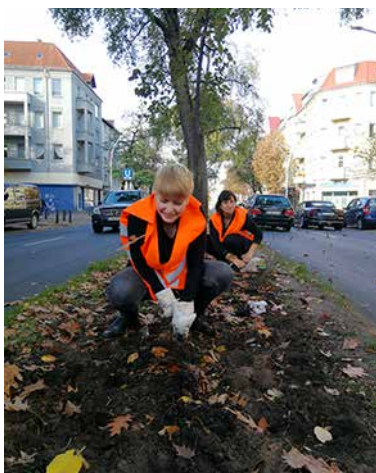
..pflanzten 1.500 Blumenzwiebeln.

Die Gewerbetreibenden des Gewerbenetzwerks „WIR FÜREUCH – Auguste-Kiez an der Scharnweberstraße“ haben am Freitag, den 25.10. tatkräftig angepackt und den Mittelstreifen der Scharnweberstraße mit Blumenzwiebeln bepflanzt.